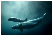
(Ballena bebé o ballenatos)